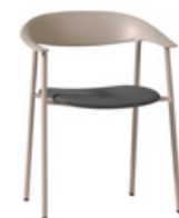
Armchair with upholstered seat Sillón con asiento tapizado